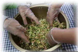
タネ作り&包み作業